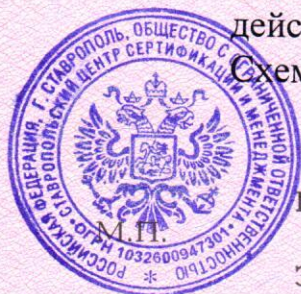
Схема сертификации 4

акта оценки санаторно-оздоровительной услуги: проживание в детском санаторно-оздоровительном лагере круглогодичного действия от 10.09.2015 г № 454-а